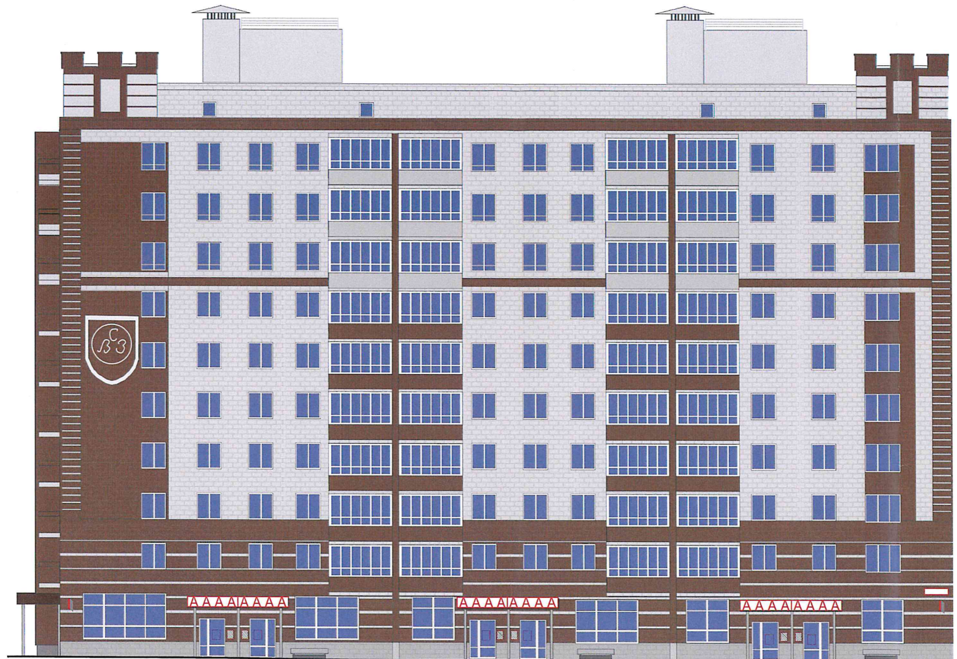
Схема возможных мест размещения информационных конструкций (вывесок), информационных табличек, указателей и витрин, входных групп и их отдельных элементов с условными обозначениями и размерами: