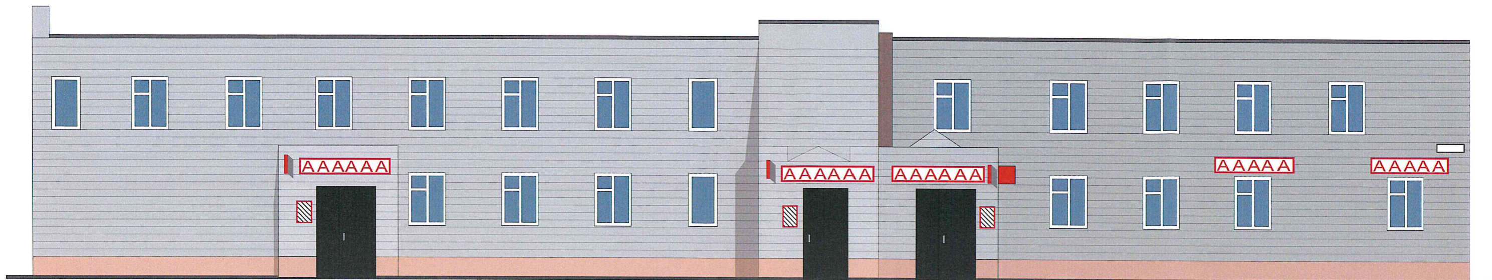
Схема возможных мест размещения информационных конструкций (вывесок), информационных табличек, указателей и витрин, входных групп и их отдельных элементов с условными обозначениями и размерами