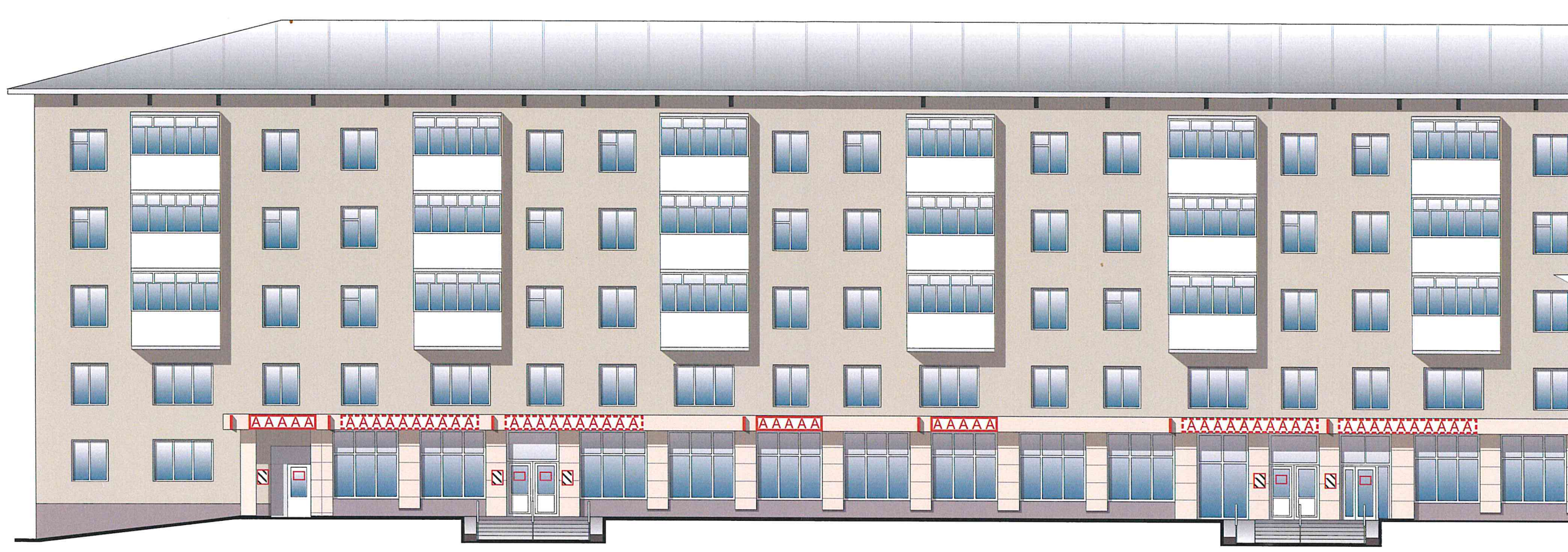
Схема возможных мест размещения информационных конструкций (вывесок), информационных табличек, указателей и витрин, входных групп и их отдельных элементов с условными обозначениями и размерами: