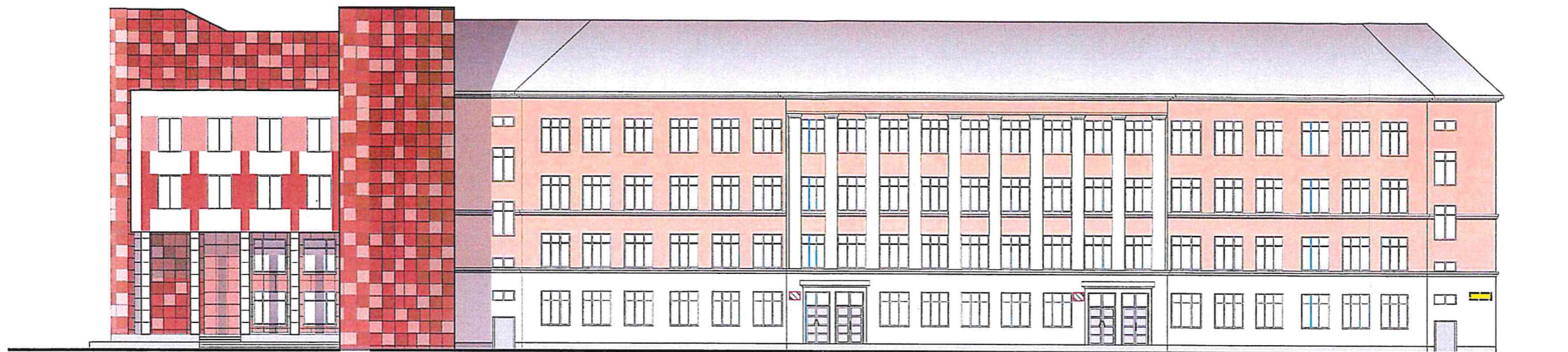
Схема возможных мест размещения информационных конструкций (вывесок), информационных табличек, указателей и витрин, входных групп и их отдельных элементов с условными обозначениями и размерами: