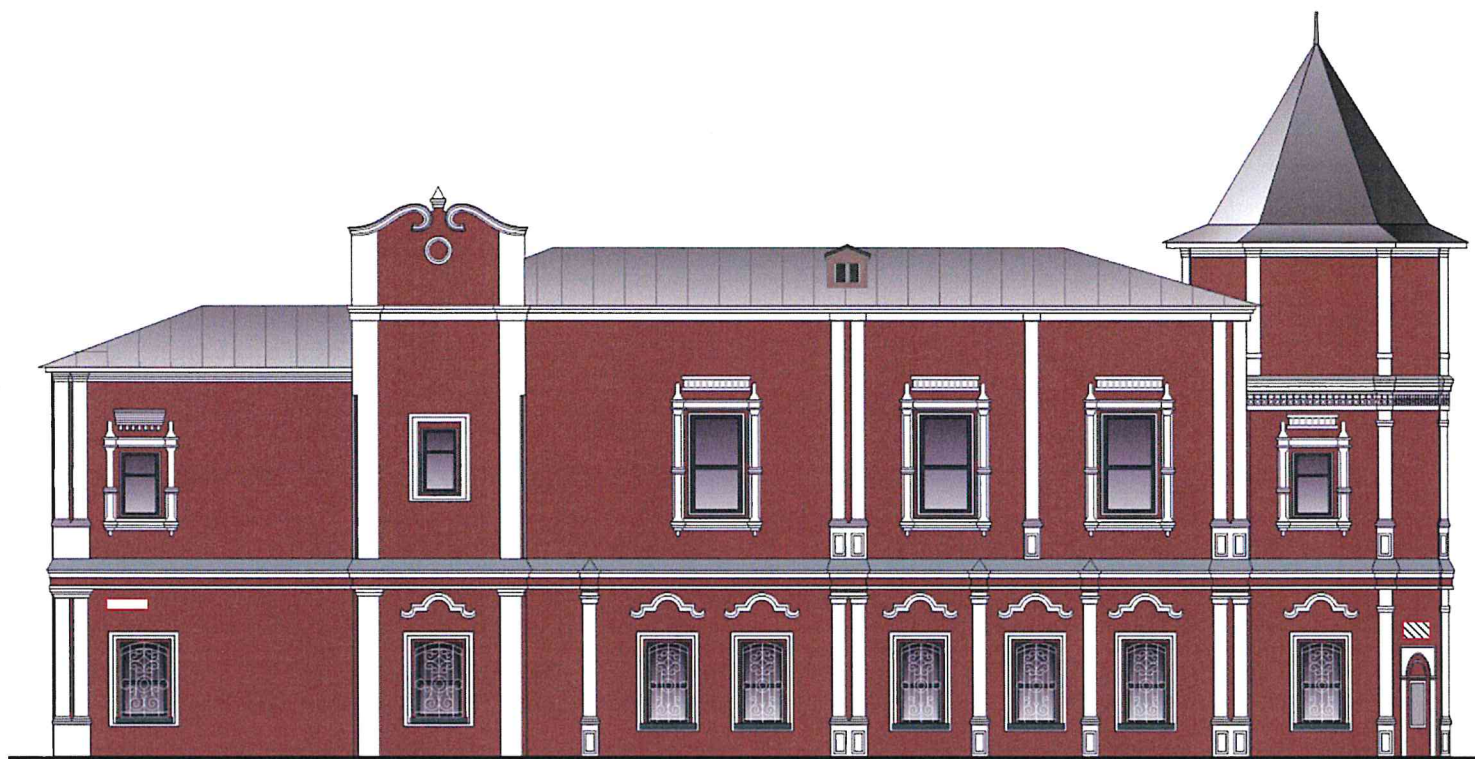
Схема возможных мест размещения информационных конструкций (вывесок), информационных табличек, указателей и витрин, входных групп и их отдельных элементов с условными обозначениями и размерами: