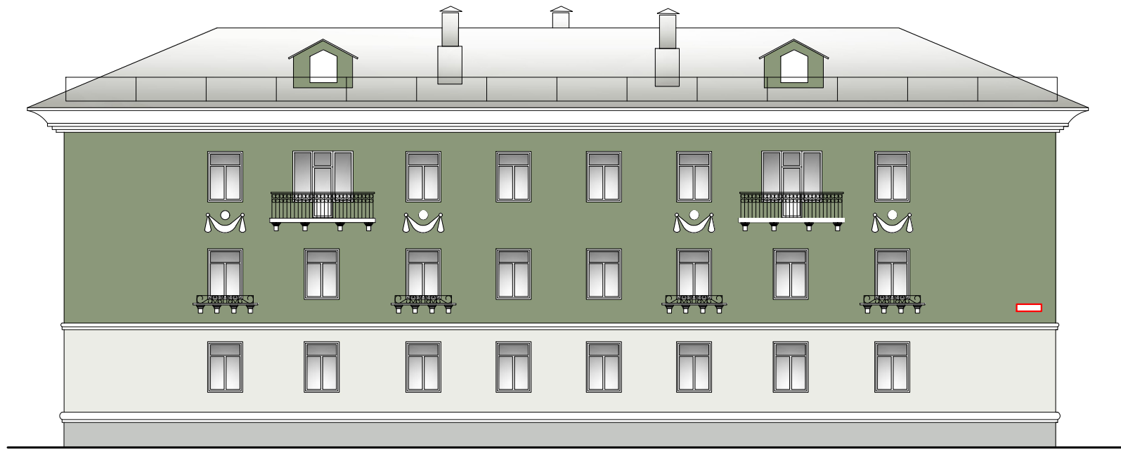
Схема возможных мест размещения информационных конструкций (вывесок), информационных табличек, указателей и витрин, входных групп и их отдельных элементов с условными обозначениями и размерами: