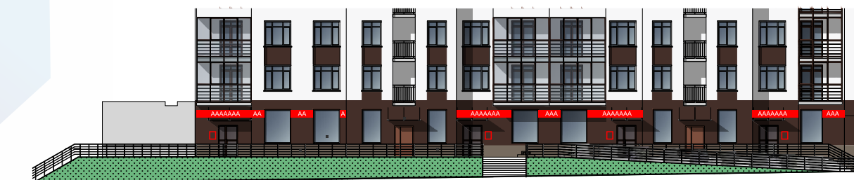
Схема возможных мест размещения информационных конструкций (вывесок), информационных табличек, указателей и витрин, входных групп и их отдельных элементов с условными обозначениями и размерами: