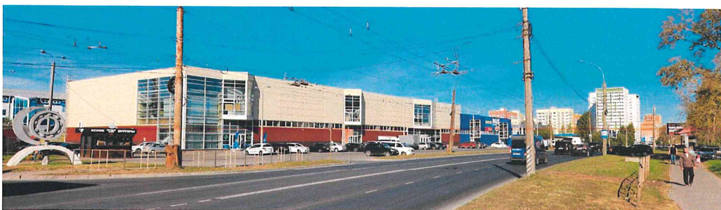
Фотографии фактического состояния фасада с указанием даты (фототаблица)