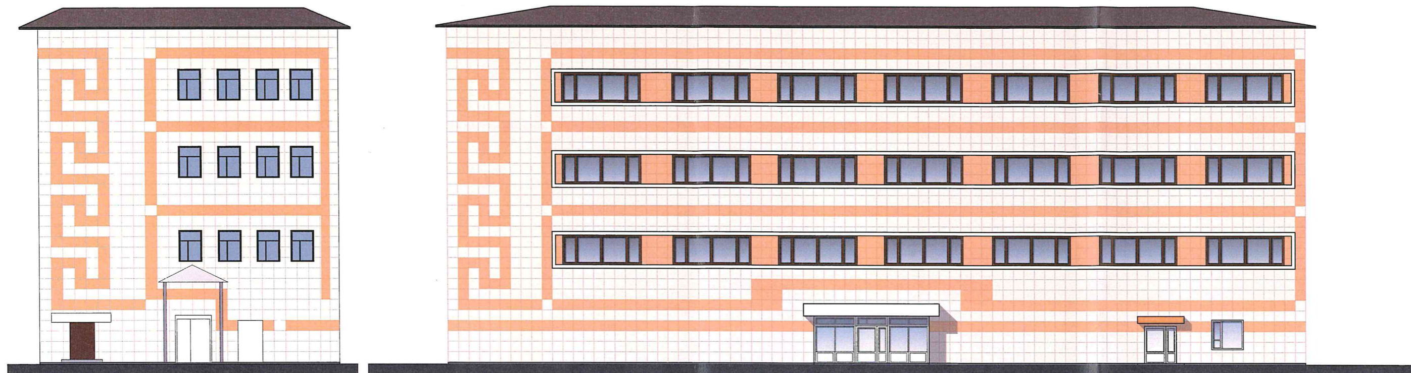
Таблица расколеровки элементов с эталонами колеров: