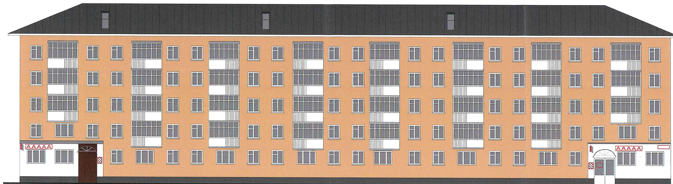
Схема возможных мест размещения информационных конструкций (вывесок), информационных табличек, указателей и витрин, входных групп и их отдельных элементов с условными обозначениями и размерами