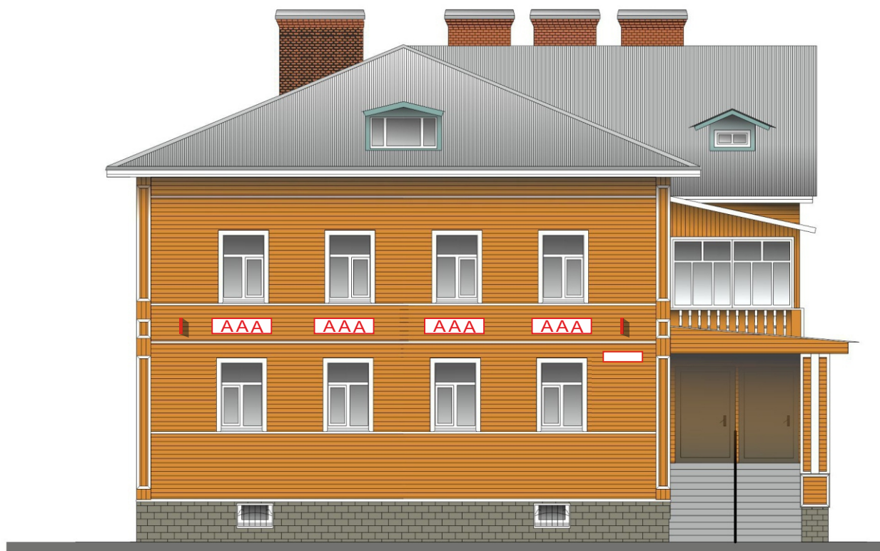
Схема возможных мест размещения информационных конструкций (вывесок), информационных табличек, указателей и витрин, входных групп и их отдельных элементов с условными обозначениями и размерами: