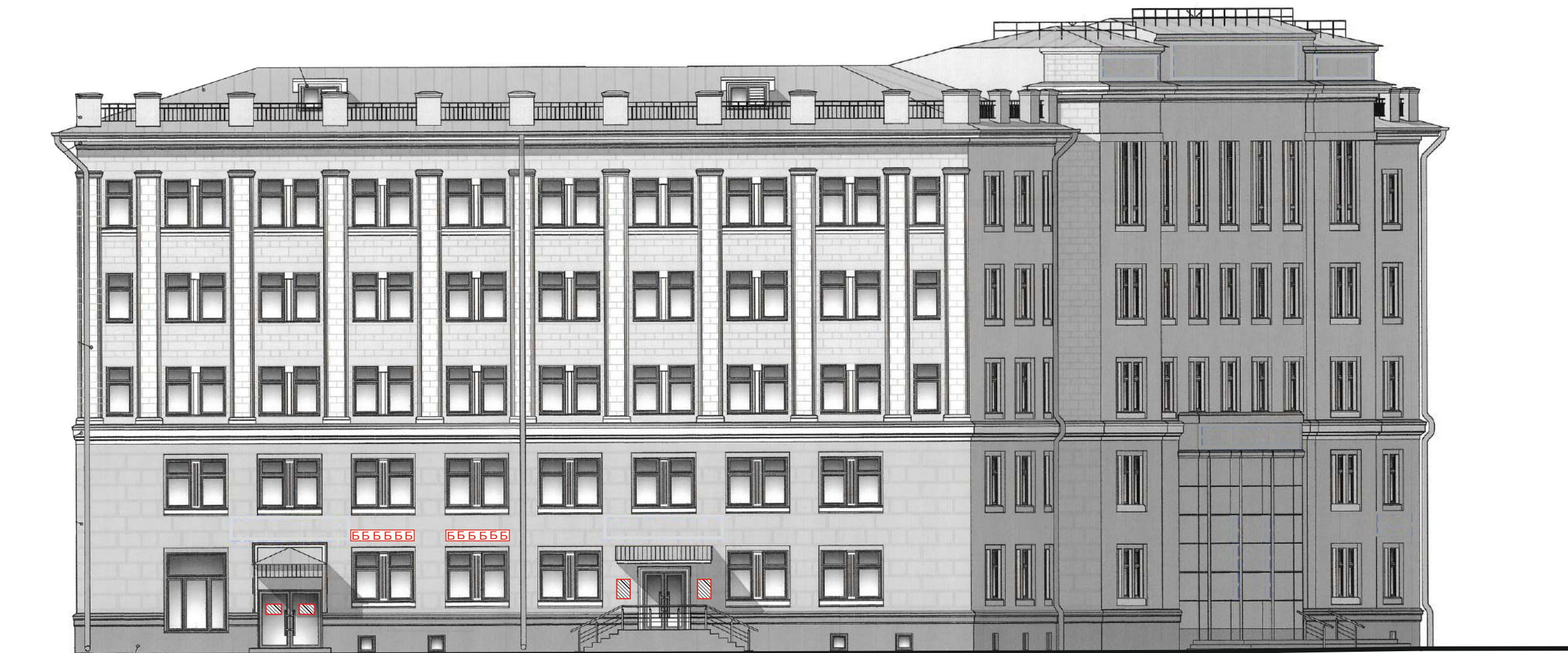
Схема возможных мест размещения информационных конструкций (вывесок), информационных табличек, указателей и витрин, входных групп и их отдельных элементов с условными обозначениями и размерами: