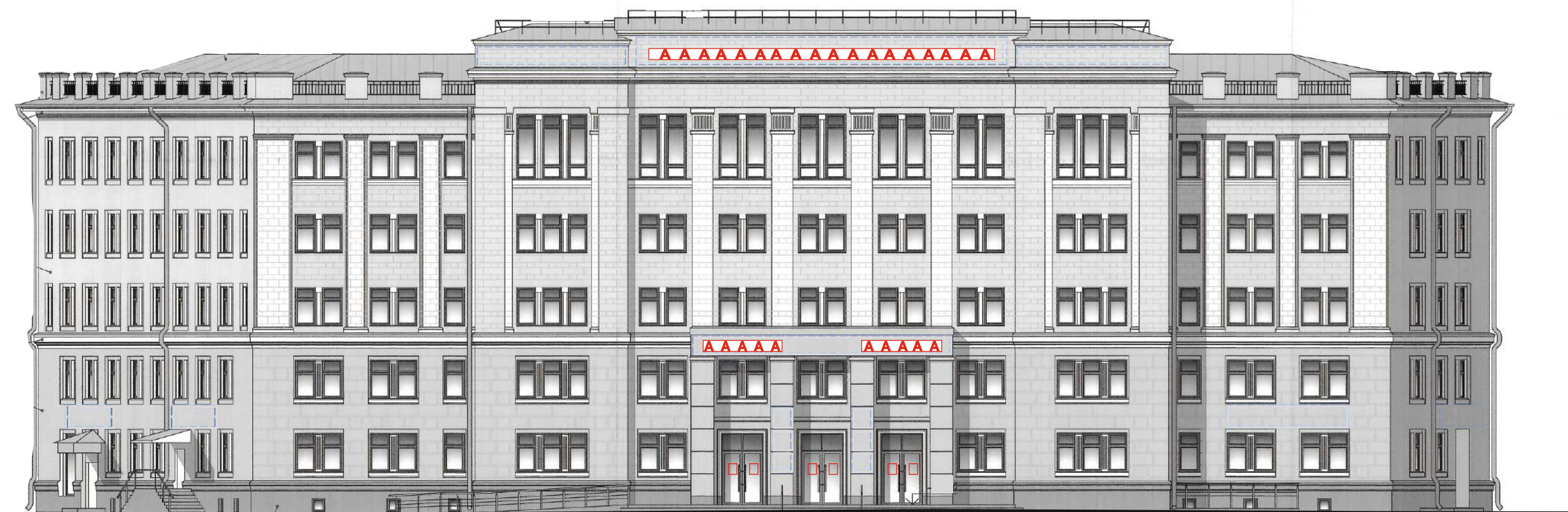
Схема возможных мест размещения информационных конструкций (вывесок), информационных табличек, указателей и витрин, входных групп и их отдельных элементов с условными обозначениями и размерами: