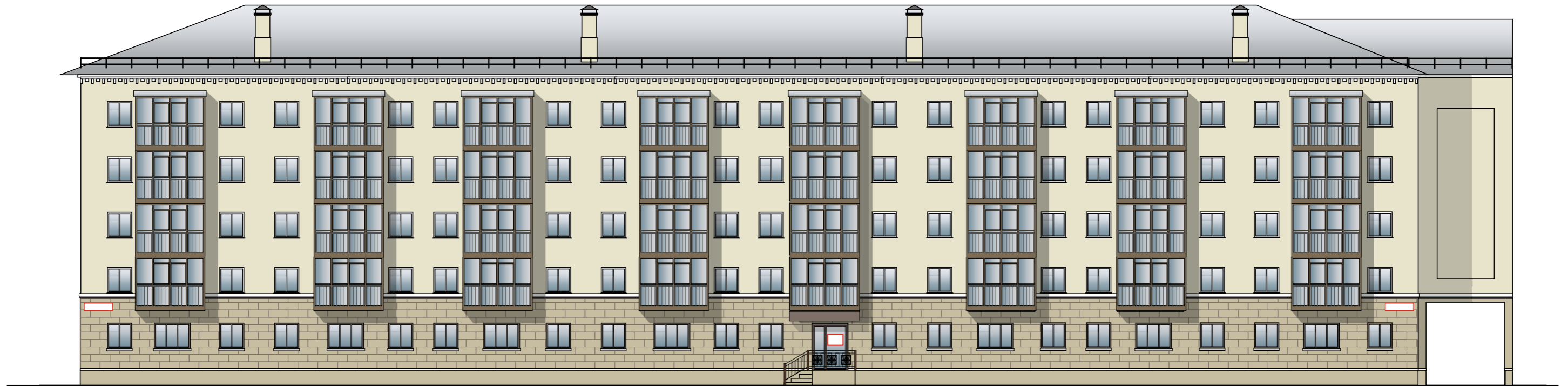
Схема возможных мест размещения информационных конструкций (вывесок), информационных табличек, указателей и витрин, входных групп и их отдельных элементов с условными обозначениями и размерами: