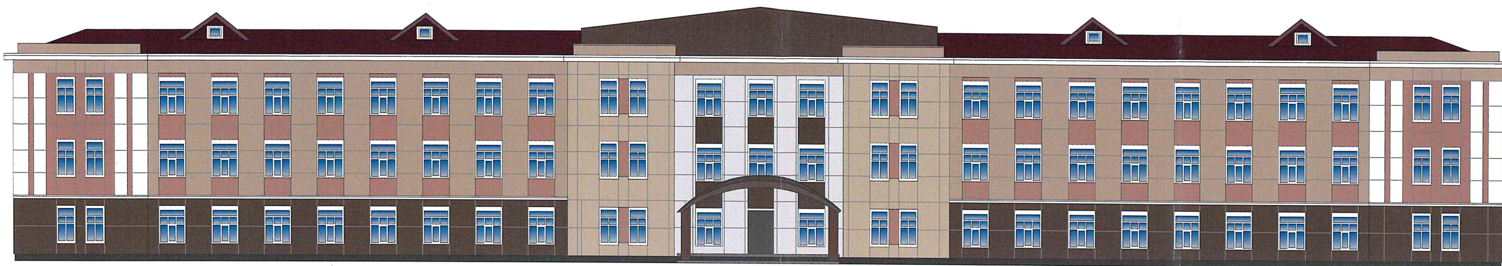
Цветовое и объемно-планировочное решение фасада: