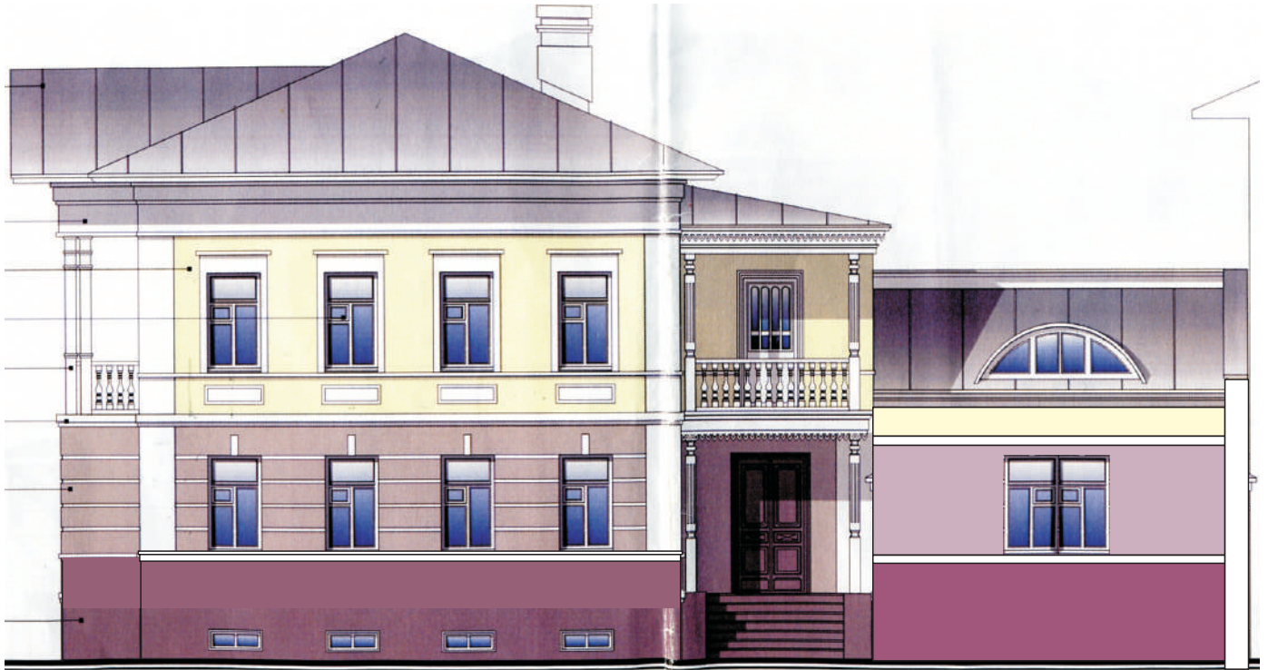
Таблица расколеровки элементов с эталонами колеров

Цветовое и объемно-планировочное решение фасада: