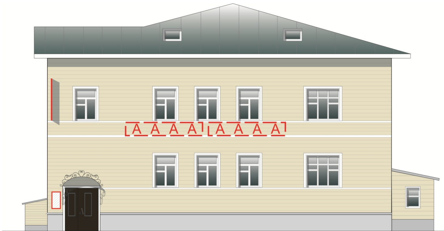
Схема мест размещения информационных конструкций (вывесок), информационных табличек, указателей и витрин, входных групп и их отдельных элементов Места и типы размещения информационных конструкций: