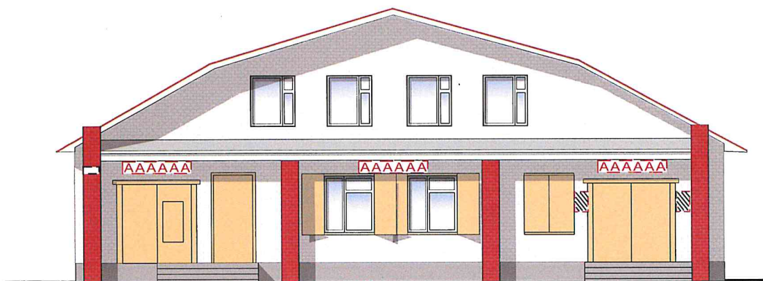
Схема мест размещения информационных конструкций (вывесок), информационных табличек, указателей и витрин, входных групп и их отдельных элементов