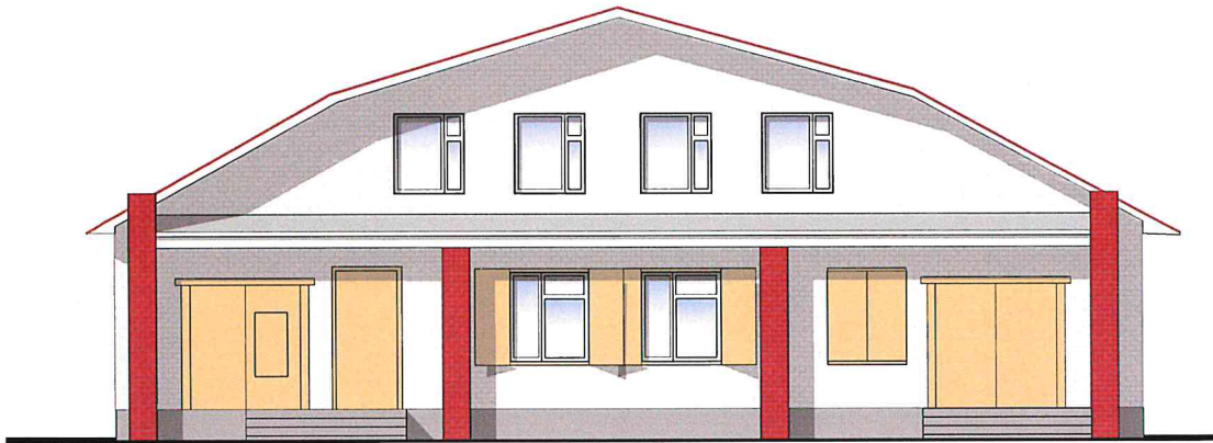
Таблица расколоровки элементов с эталонами колеров