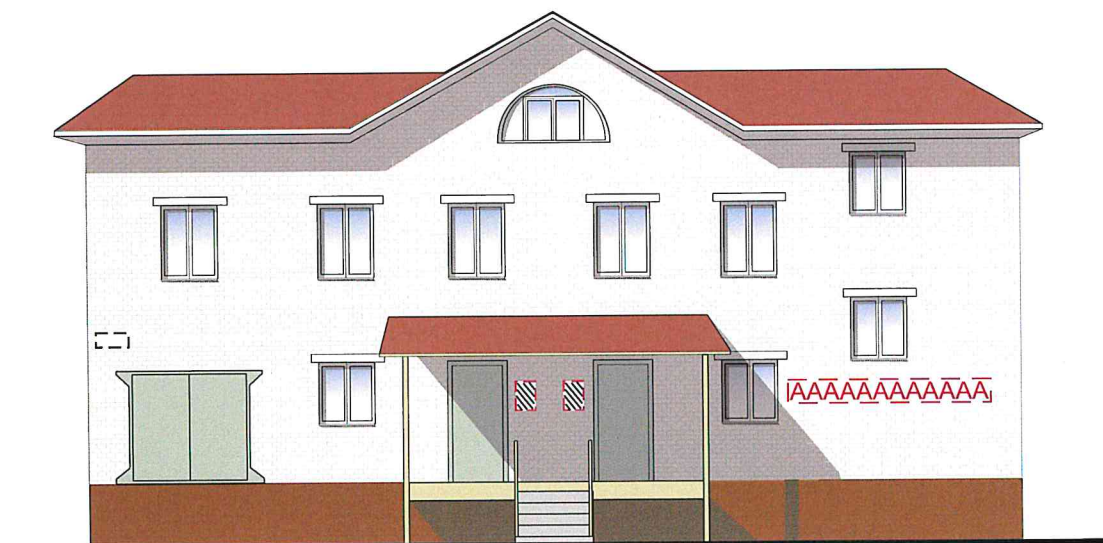
Схема мест размещения информационных конструкций (вывесок), информационных табличек, указателей и витрин, входных групп и их отдельных элементов