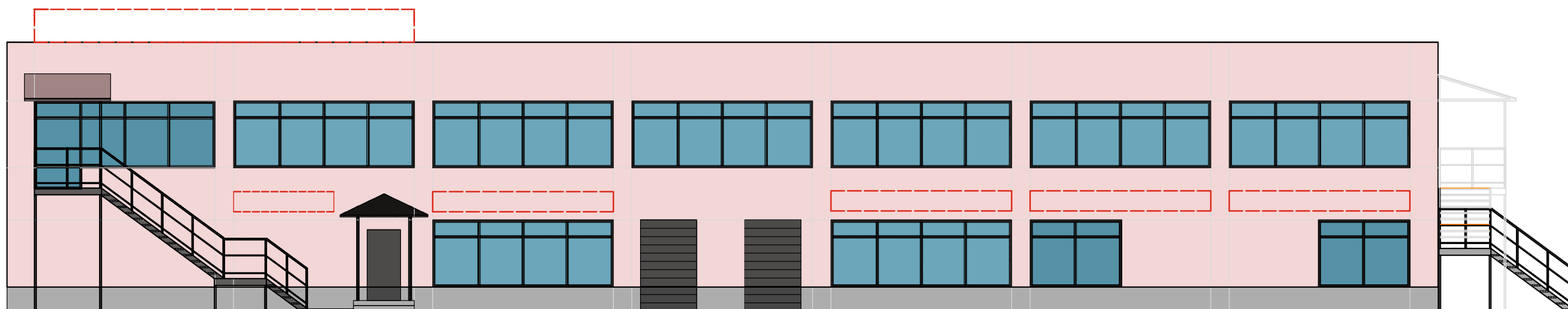
Схема мест размещения информационных конструкций (вывесок), информационных табличек, указателей и витрин, входных групп и их отдельных элементов Места и типы размещения информационных конструкций: