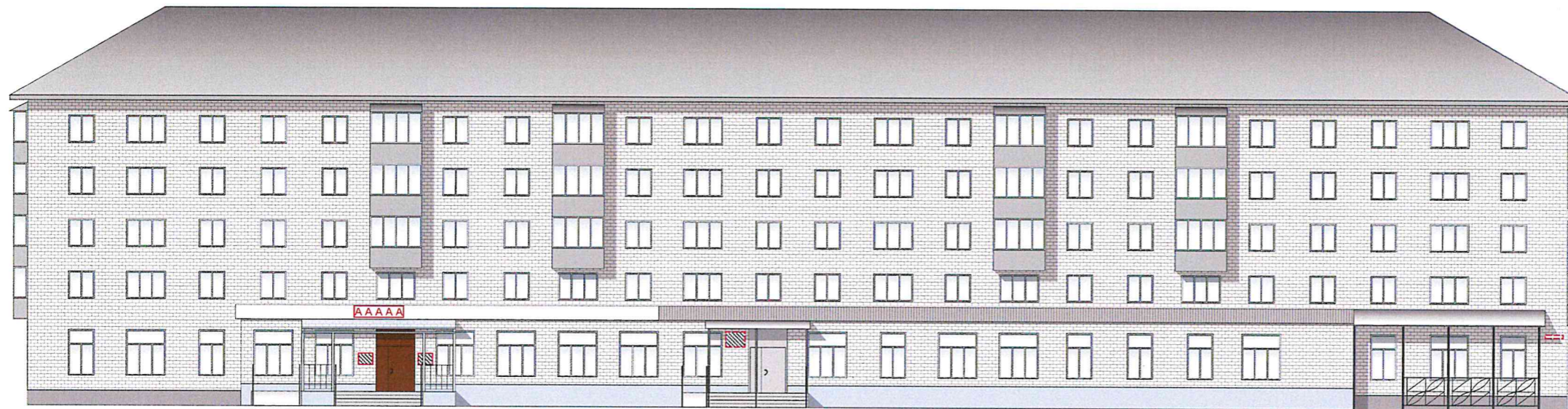
Схема возможных мест размещения информационных конструкций (вывесок), информационных табличек, указателей и витрин, входных групп и их отдельных элементов с условными обозначениями и размерами: