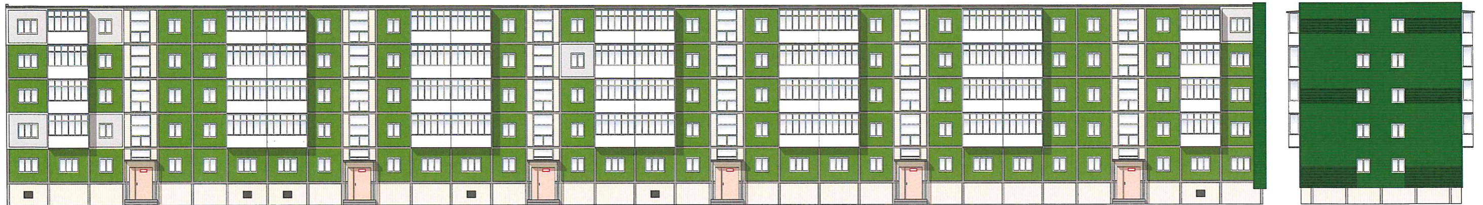
Схема возможных мест размещения информационных конструкций (вывесок), информационных табличек, указателей и витрин, входных групп и их отдельных элементов с условными обозначениями и размерами: