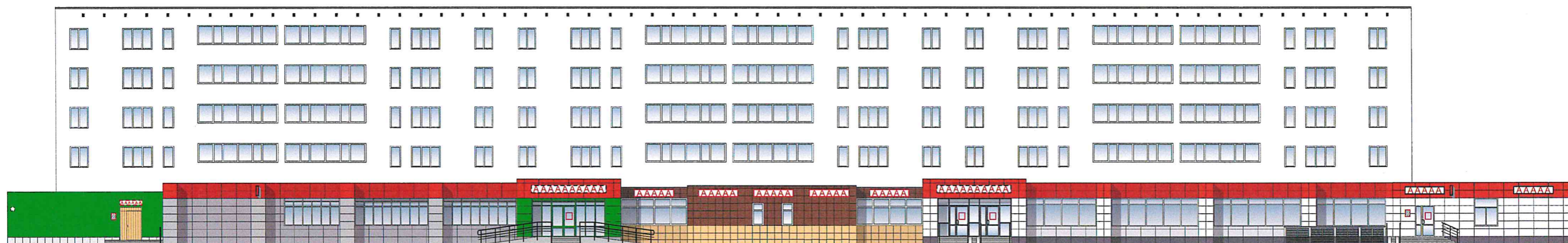
Схема возможных мест размещения информационных конструкций (вывесок), информационных табличек, указателей и витрин, входных групп и их отдельных элементов с условными обозначениями и размерами: