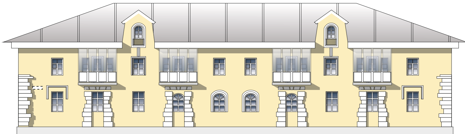
Схема возможных мест размещения информационных конструкций (вывесок), информационных табличек, указателей и витрин, входных групп и отдельных элементов с условными обозначениями и размерами: