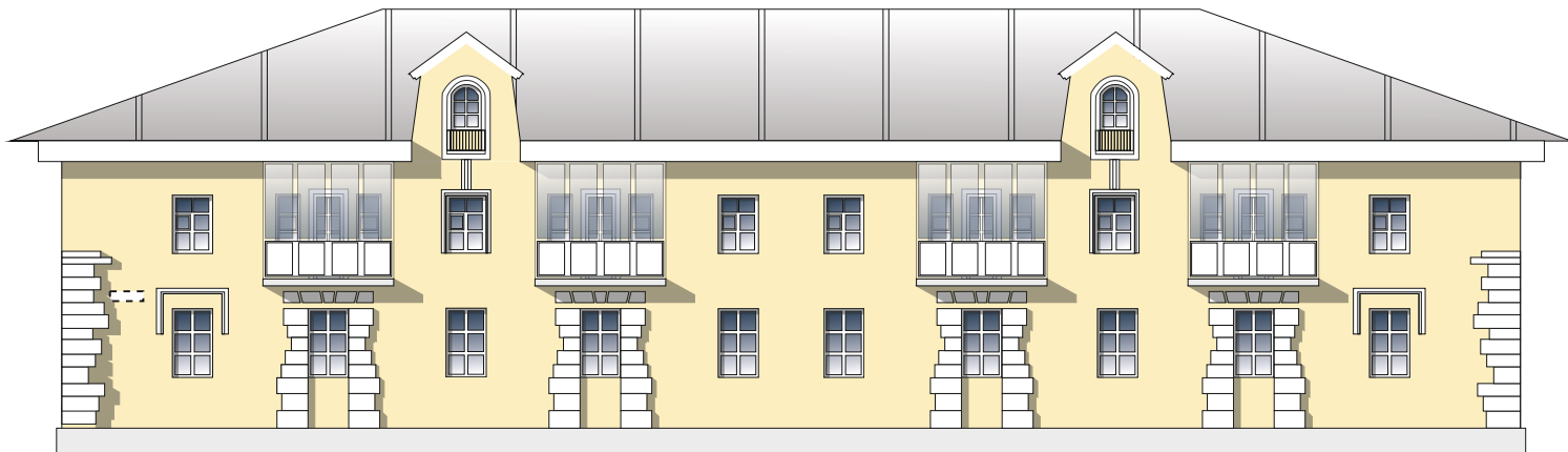
Схема возможных мест размещения информационных конструкций (вывесок), информационных табличек, указателей и витрин, входных групп и отдельных элементов с условными обозначениями и размерами: