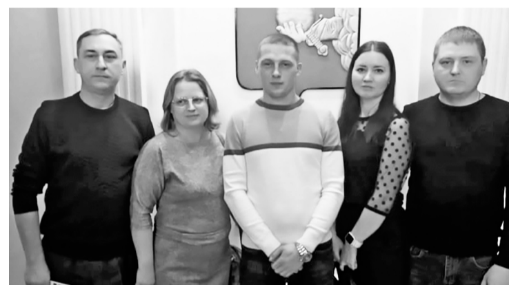
Династия Гринишиных работает на вологодском «Водоканале» уже около 100 лет.

Принять участие в обсуждении инициативы по созданию звания «Человек труда Вологодской области» может любой вологжанин. Для этого нужно заполнить анкету в региональном Штабе общественной поддержки.