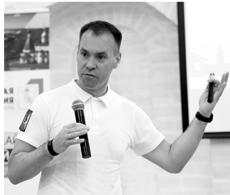
Председатель Законодательного Собрания Вологодской области Сергей Жестянников: «Предложения вологжан – это база, от которой будем отталкиваться в формировании Стратегии развития региона на ближайшие пять лет».

Не менее трёх лидирующих предложений от каждого муниципалитета включают в Стратегию развития Вологодчины.