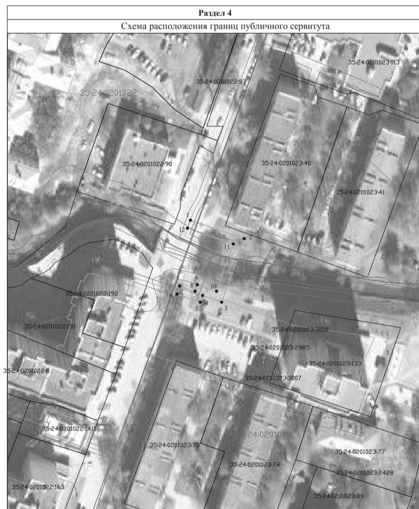
Масштаб 1:1000 Система координат: МСК-35 2 зона

Условные обозначения: - граница и обозначение территории публичного сервитута - существующая часть границы, имеющиеся в ЕГРН сведения о которой достаточны для определения ее местоположения - граница ОКС - граница кадастрового квартала - граница зоны с особыми условиями использования территории - обозначение характерной точки границы, сведения о которой позволяют однозначно определить ее положение на местности 35:24:0201023:133 - кадастровый номер объекта недвижимости 35:24:0201023 - номер кадастрового квартала