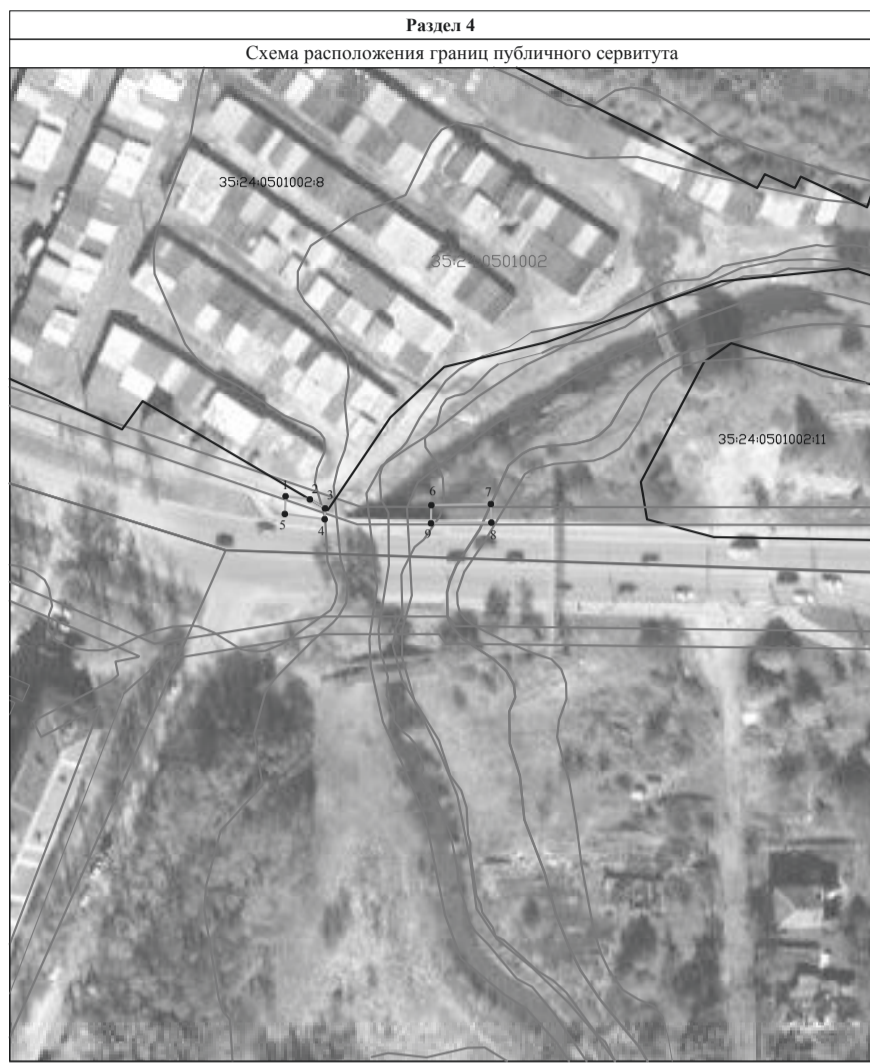
Масштаб 1:1000 Система координат: МСК-35 2 зона

Условные обозначения: - граница и обозначение территории публичного сервитута - существующая часть границы, имеющиеся в ЕГРН сведения о которой достаточны для определения ее местоположения - граница ОКС - граница кадастрового квартала - граница зоны с особыми условиями использования территории - обозначение характерной точки границы, сведения о которой позволяют однозначно определить ее положение на местности 35:24:0501002:8 - кадастровый номер объекта недвижимости 35:24:0501002 - номер кадастрового квартала