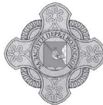
Рисунок нагрудного знака «За заслуги перед Вологдой»

УТВЕРЖДЕНО постановлением Главы города Вологды от 14 февраля 2017 года № 45