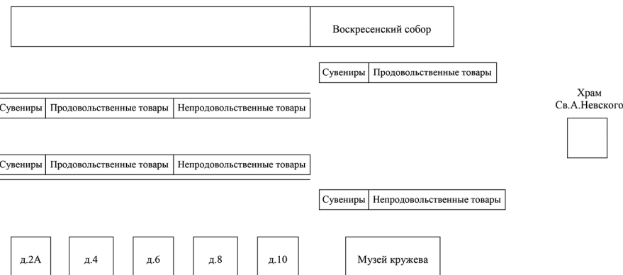
Схема размещения торговых мест ярмарок на Кремлевской площади города Вологды

Приложение № 3 к постановлению Администрации города Вологды от 21.02.2019 № 175