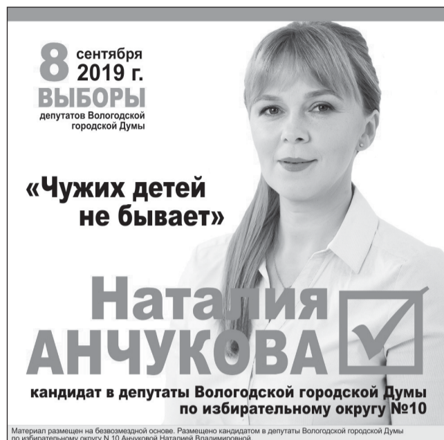
Материал размещен на безвозмездной основе. Размещено кандидатом Анчуковой Н.В.