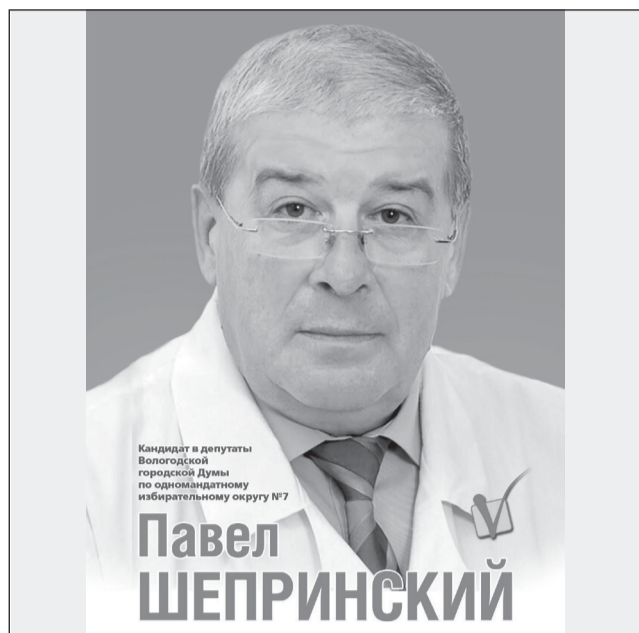
Материал размещен на безвозмездной основе. Размещено кандидатом Шепринским П.Е.