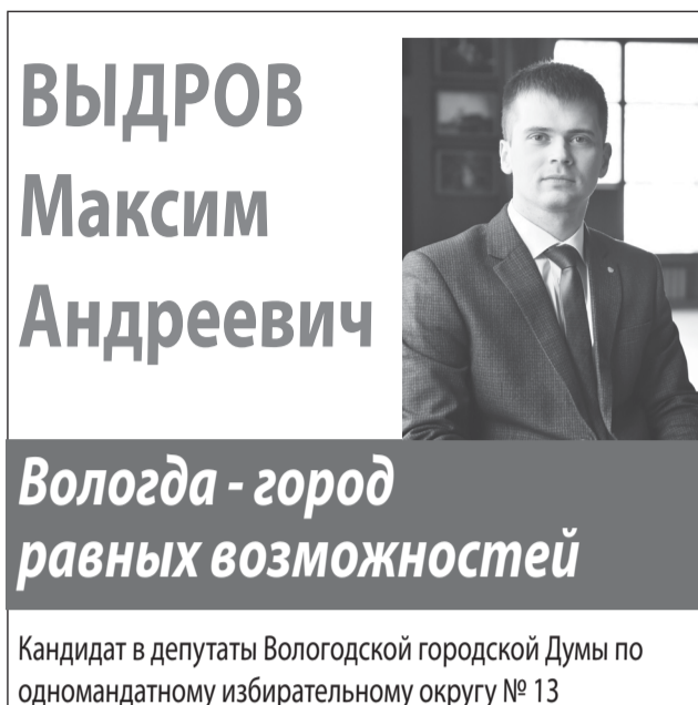
Материал размещен на безвозмездной основе. Размещено кандидатом Выдровым М.А.