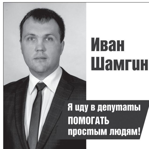
Материал размещен на безвозмездной основе. Размещено кандидатом Шамгиным И.В.

Место предоставлено для агитационных материалов кандидатов в депутаты городской Думы Вологды