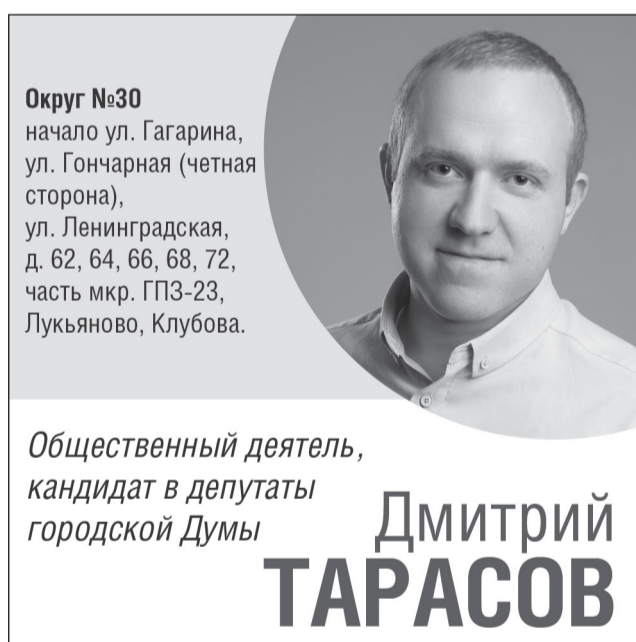
Материал размещен на безвозмездной основе. Размещено кандидатом Тарасовым Д.В.

Место предоставлено для агитационных материалов кандидатов в депутаты городской Думы Вологды