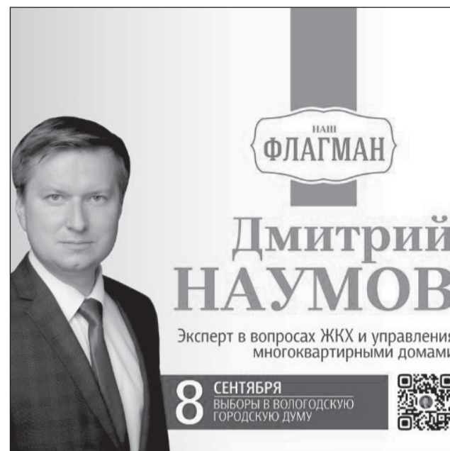
Материал размещен на безвозмездной основе. Размещено кандидатом Наумовым Д.В.