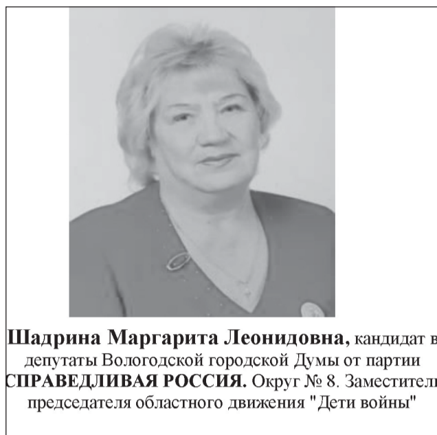
Материал размещен на безвозмездной основе. Размещено кандидатом Шадриной М.Л.