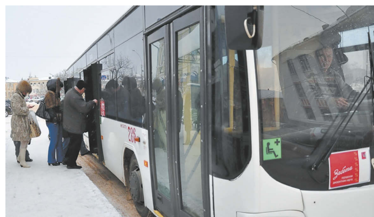
Главный аргумент к пересмотру тарифов – рост цен на топливо.

Итоги обсуждения станут известны в ближайшее время. Кстати, во многих регионах цены на проезд в общественном транспорте повышают регулярно, а в соседнем Череповце – ежегодно. Последнее повышение в городе металлургов состоялось два месяца назад: одна поездка обходится череповчанам в 24 рубля, при этом никаких дисконтов нет.