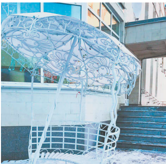
Желания, загаданные под зонтом, обязательно сбудутся.

Установила новую достопримечательность одна из коммерческих компаний областной столицы. Напомним, что практически все современные арт-объекты подарены городу представителями бизнеса. Среди них – «Птица Говорун», «Мельница желаний», «Дверь в...» и другие.