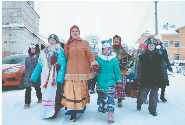
С колядками молодежь проходит по улице, стучится в каждый дом.

Текст: Алена МАРУШКИНА