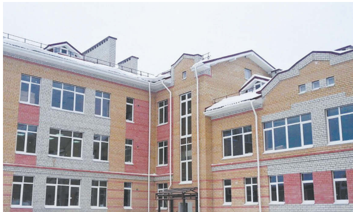
Строительная готовность детского сада – порядка 85-90 %.

Строительство объекта затянулось из-за проблем с подключением к теплосети. Одна из частных теплоснабжающих организаций неправомерно затянула процесс, несмотря на согласованные проект и технические условия. Сейчас все коммуникации подведены, а отделочные работы в финальной стадии.