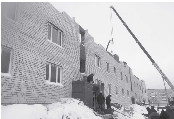
Будущая пятиэтажка в Молочном.

Напомним, в новогодние праздники из-за аномально низких температур строительство пришлось приостановить. Это вызвало отставание в графике, но подрядчики сейчас увеличили темп работ. Так, в доме в селе Молочное на первом этаже уже готовы межкомнатные перегородки, установлены пластиковые окна, проложена канализация и водопроводные сети. Сейчас оконные рамы вставляют на втором этаже, завершены работы по формированию перекрытия. Кладка кирпича ведется на уровне третьего этажа, на этих работах задействовано около 20 человек. Один из важных этапов – мон-