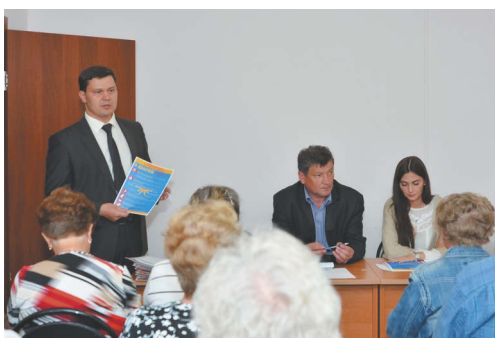
Свои права и обязанности собственники жилья должны знать.

Яркими и интересными событиями стали уроки энергосбережения среди школьников на основе онлайн-игры «ЖЭКа» и конкурс среди жителей многоквартирных домов. Одними из его победителей стали вологжане, проживающие на ул. Мишкольцкая, 3. Уже три года они следят за своим двором – облагораживают не только фасад, но и территорию вокруг многоэтажки. Эта работа ведется в тесном контакте с