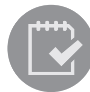
График приема граждан в Общественных приемных Главы города Вологды 25 января 2016 года

жиме. В ночь на улицы выходят 36 машин компании-подрядчика. Это грейдеры, комбинированные дорожные машины, роторы, самосвалы для вывоза снега, фронтальные погрузчики. Вся техника оборудована системой «ГЛОНАСС», для того, чтобы эффективность уборки городские власти могли оценить в режиме реального времени.