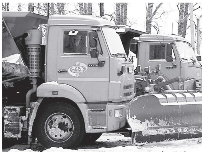
Теперь компания имеет технические возможности заниматься уборкой более интенсивно.

Это не единственное обновление в парке компании «Магистраль». В конце прошлого года на предприятие