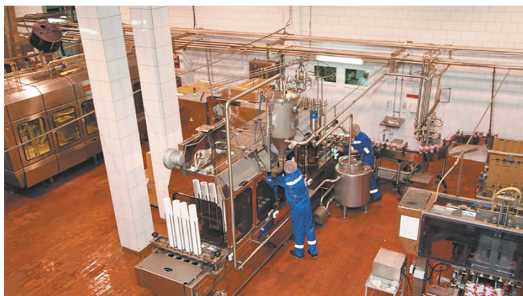
Объем инвестиций в вологодскую экономику по сравнению с предыдущим годом вырос на 8 %.

По прогнозам экспертов, общий объем инвестиций по реализуемым проектам оценивается в 11 млрд рублей. В результате в городе будет создано порядка 1500 новых рабочих мест.