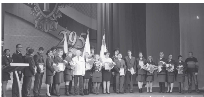
Торжественное собрание в честь юбилейной даты.

В честь юбилея 50 работников прокуратуры Вологодской области и ветераны ведомства получили награды, памятные подарки, также присвоены почетные звания.