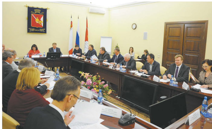
Всего в состав Общественного совета войдут 33 человека.

Выдвинуть своих кандидатов для вступления в Общественный совет города могут некоммерческие общественные организации. С 16 по 25 января заявления принимаются по адресу: Каменный мост, 4, каб. 76. Подробности