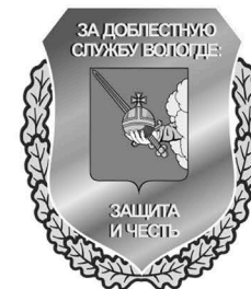
Рисунок нагрудного знака «За доблестную службу Вологде: защита и честь»