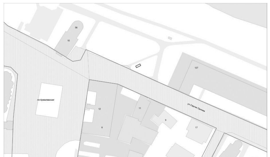
УЛ. СЕРГЕЯ ОРЛОВА, ВБЛИЗИ ДОМА №10

Приложение № 2 к постановлению Администрации города Вологды от 25.03.2019 № 323 «Приложение № 10 к дислокации размещения объектов по оказанию услуг населению на территории муниципального образования «Город Вологда»